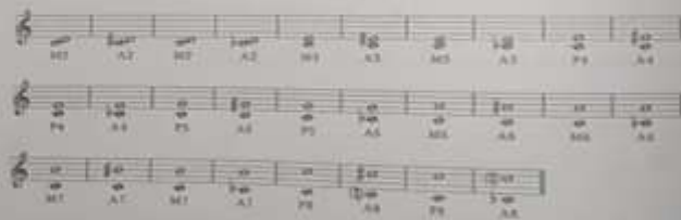
شكل رقم (٣١)

٣- ينتقل إلى المسافات الزائدة ويطلب بنائها من نغمة Do ويستخدم ذات الطريقة في حركة نغمة المسافة ويطلب باستخدام درجات ركوز مختلفة ليكون هناك تنمية للطالب لكيفية الأستنتاج على البيانو مباشرة. واستخدم الحرف A للتعبير عن المسافات الزائدة وهي اختصار لكلمة Augmented Intervals