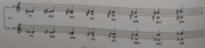
شكل رقم (٢٩)

١- يبدأ في التركيز على المسافات سواء كانت لحنية أو هارمونية ولكن المشتقة من السلم الكبير ويطلب من الطلاب بعرفها في جميع السلالم الكبيرة سواء في دائرة البيمولات أو دائرة النبيزات. ونلاحظ أنها المسافات الكبيرة والتامة. وقد استخدم بيركويتر حرف M للتعبير عن المسافات الكبيرة وهي اختصار لكلمة Major Intervals وتعني المسافات الكبيرة كما استخدم حرف P للتعبير عن المسافات التامة وهي اختصار لكلمة Perfect Intervals وتعني المسافات التامة